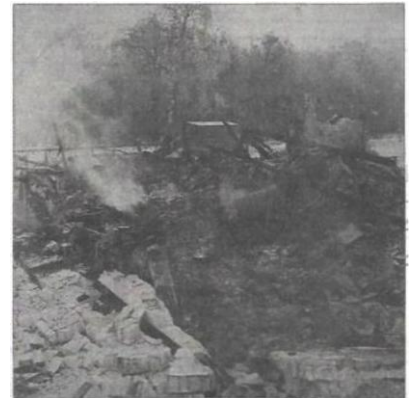
Deze foto toont wat er van de boerderij overgebleven is. Alles wat ik had was verbrand.

Na ontslag uit het ziekenhuis ging ik naar 'een woonwagen' waar wij tijdelijk in gingen wonen. Ook alle sleutels van alle bungalows waren verbrand en moesten we vernieuwen. Aannemer De K. deed alle moeite om een nieuwe woning te mogen bouwen/zetten en ging met de Gemeente praten, er moest zo gauw mogelijk een