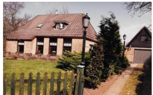
Door mij gebouwd.

Toen ik eenmaal bij Nel was ingetrokken, wou ze bloot achter huis zonnebaden en ben ik dat ook gaan doen. De burens wisten dit en zaten soms op de loer te kijken, we moesten steeds in de gaten houden wanneer zij op de loer zaten. Ook in huis